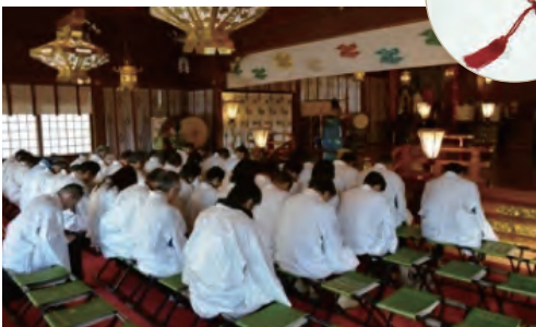
▲ 格衣(かぐい)という白い羽織を着て祈禱