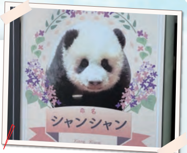
シャンシャンの頭が見えた人もいました!

https://blog.goo.ne.jp/asahiforklift/e/75eb2c704fedfed75f6291515cedc54e