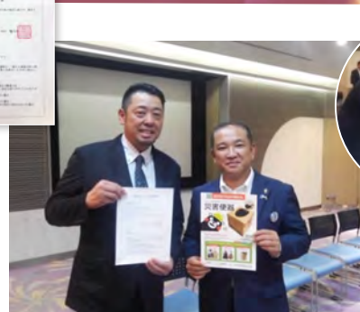
▲相模原市長と記念撮影